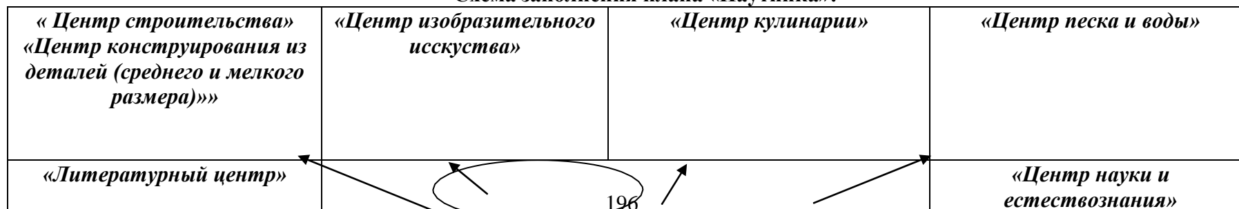
Схема заполнения плана «Паутинка»:

Воспитатели и родители предлагают свои идеи наряду с детьми. Идеи взрослых записываются также печатными буквами, но другим цветом. Это дает обильный аналитический материал (насколько инициативен тот или иной ребенок, чья инициатива преобладает - детей или взрослых, какие виды деятельности чаще всего предлагаются, какие виды деятельности или центры не вызывают инициативы детей и т.п.)